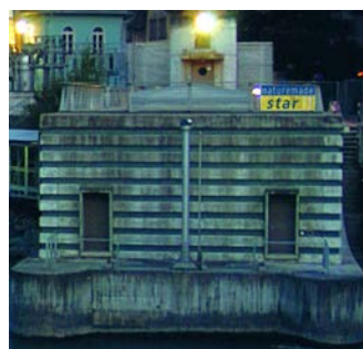
Aarewerk Energie Thun AG

Unterstützung durch Geschäftsstelle VUE: